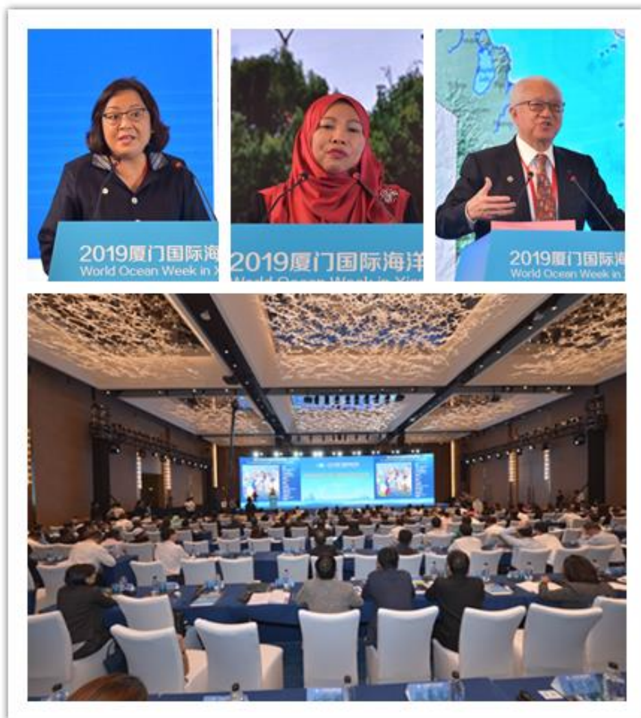
厦门国际海洋论坛

PNLG年会全体嘉宾出席了2019厦门国际海洋论坛暨第一届构建海洋命运共同体论坛，其中PEMSEA执行主任艾米·冈萨雷斯女士、PNLG主席诺兰妮·宾缇·罗斯兰女士以及菲律宾八打雁省省长赫米兰度·曼丹安那斯先生在会上做了发言。