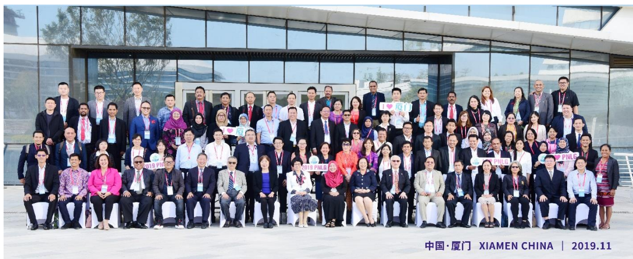
2019 PNLG 年会参会嘉宾合影

2019 年 11 月 1 日-2 日，2019 年东亚海岸带可持续发展地方政府网络（PNLG）年会在福建省厦门市举行。本次会议由厦门市人民政府和东亚海环境管理区域组织（PEMSEA）主办，以“蓝色伙伴 共同命运”为主题，通过案例学习、专题讨论、全体成员大会、政策论坛和实地考察等内容，促进成员间的经验交流，加快实现联合国可持续发展目标，推动东亚海区域的可持续发展。来自中国、柬埔寨、印度尼西亚、马来西亚、菲律宾、泰国、东帝汶、越南和缅甸等 9 个国家 33 个城市的官员代表，及 PEMSEA、厦门大学、中国—PEMSEA 可持续发展中心和泰国东方大学等国际组织和机构的专家学者，共 140 多人出席了此次会议，参会城市数量为历届最多。