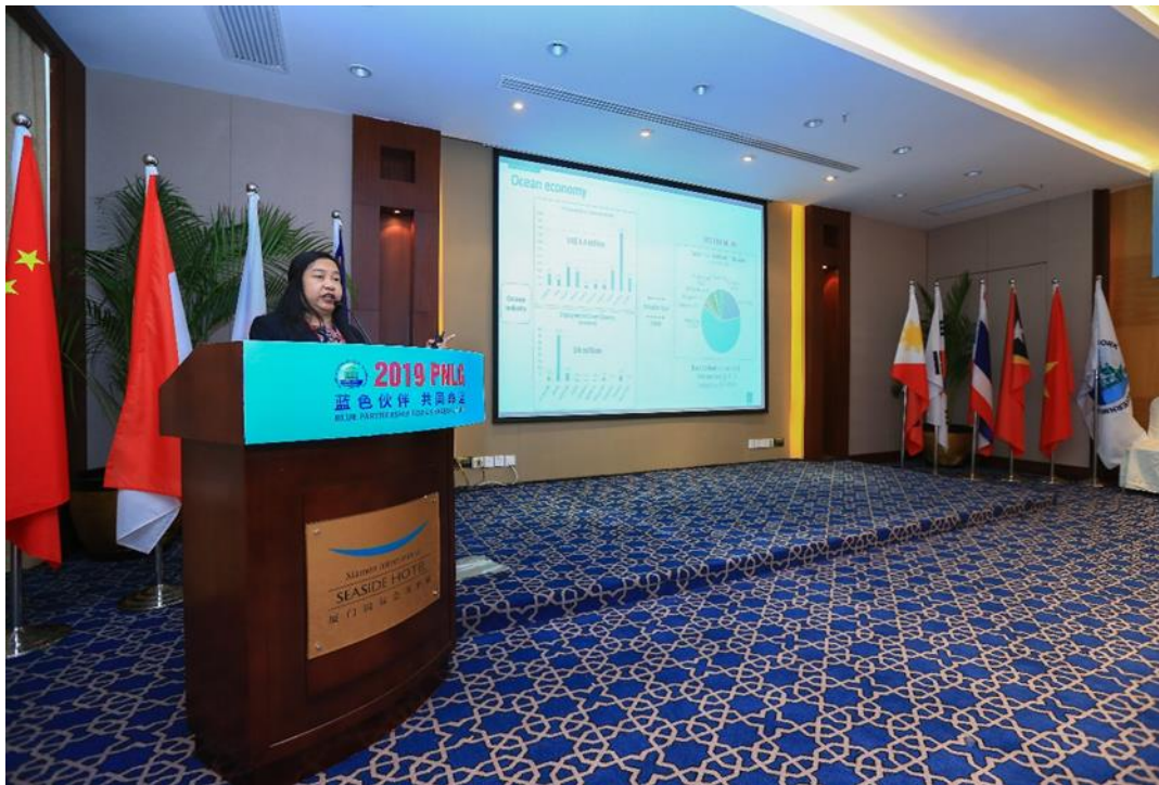
玛莉亚·克拉棕·艾芭拉薇娅女士做主旨演讲

艾芭拉薇娅女士介绍了目前国际上对蓝色经济的定义，强调了发展蓝色经济对保护海洋和促进经济发展的重要性，分析了东亚海区域的蓝色经济发展现状和面临的挑战，并就各国可开展的蓝色经济领域进行了阐释包括：滨海生态旅游、绿色港口经济、可持续的渔业和水产养殖业以及包括海洋生物医药在内的海洋新兴产业。